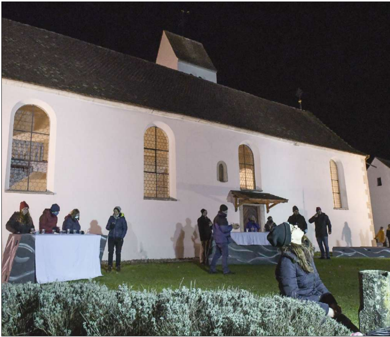
Die erste «Outdoor»-Probe am Originalschauplatz vor der Alten Kirche in Wohlenschwil